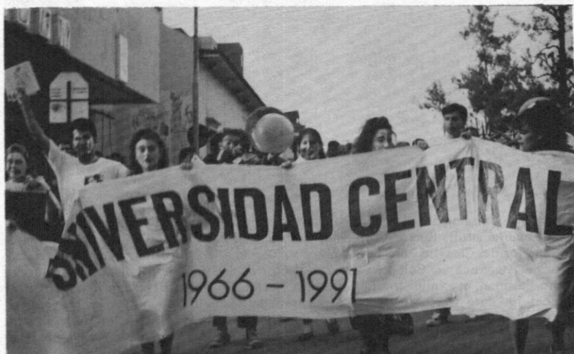
Una muestra de la alegría centralista.

9:30 a.m. CARRERA DE OBSERVACION Salida: Calle 22 Cra. 5a. Llegada: ICA Tibaitatá (Troncal Occidente, Kilómetro 7)