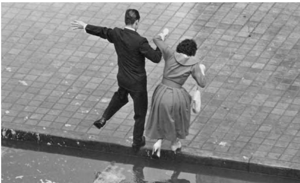
"Salta salta", 1960.