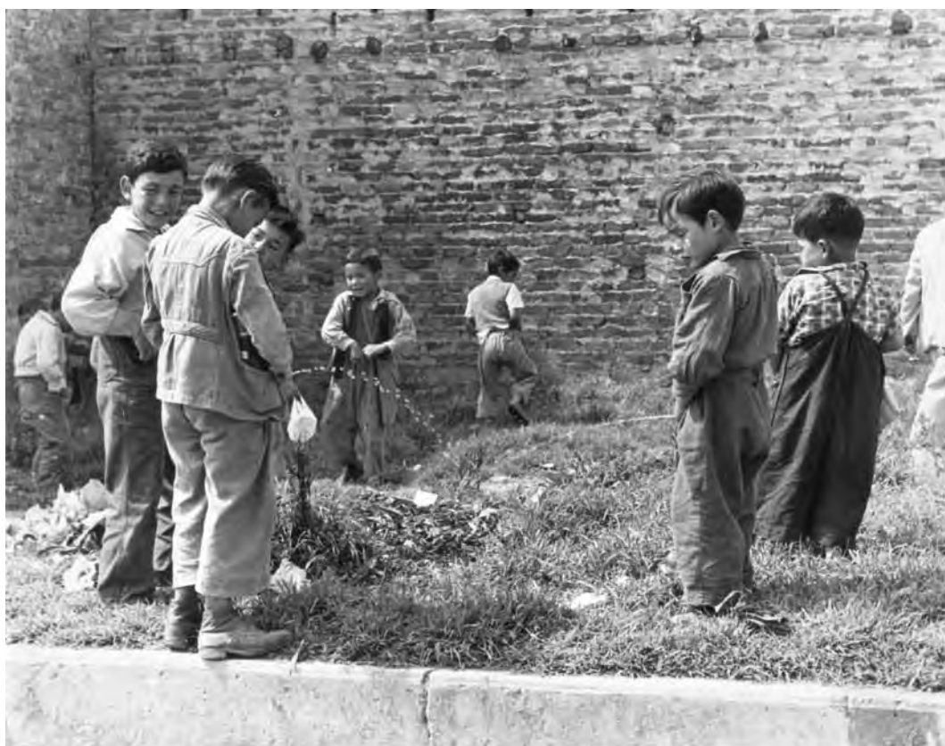
"Dejad que los niños vengan al pasto...", Escuela Berrio San Fernando, Colombia, 1965.