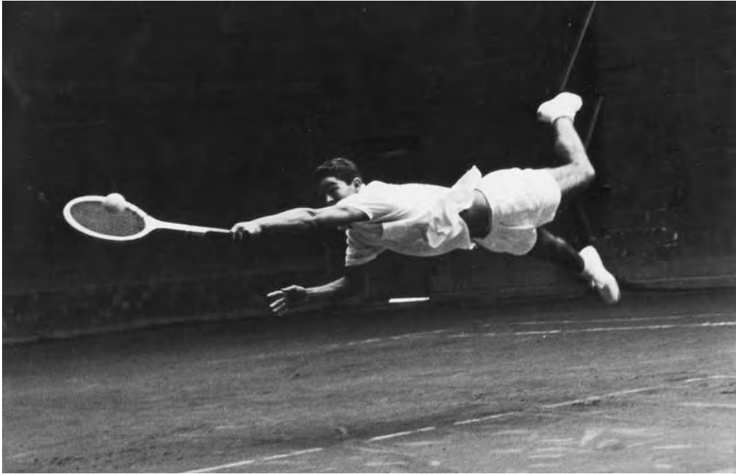
"A volar, joven", Bogotá, Colombia, 1961.