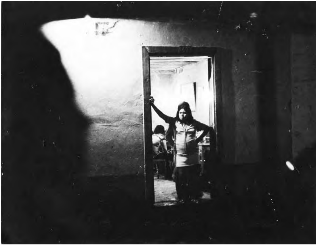
"Mujer de vida airada pueblerina", Sevilla, Colombia, 1979.