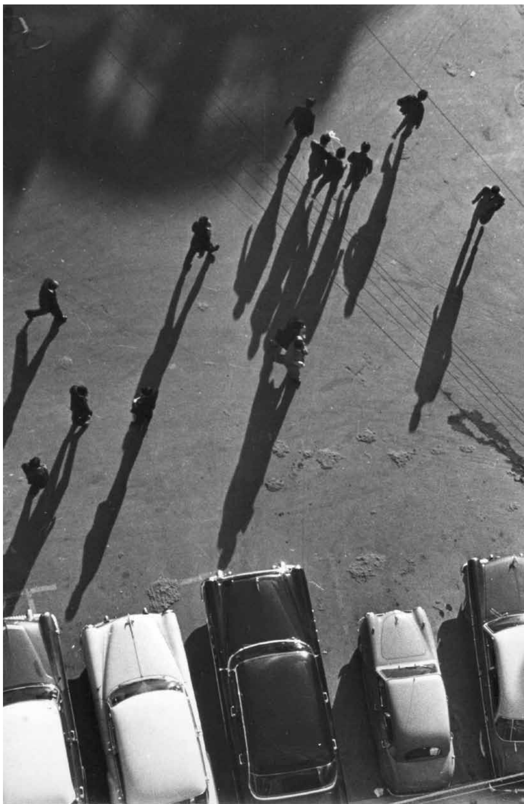
"Luz y sombras".