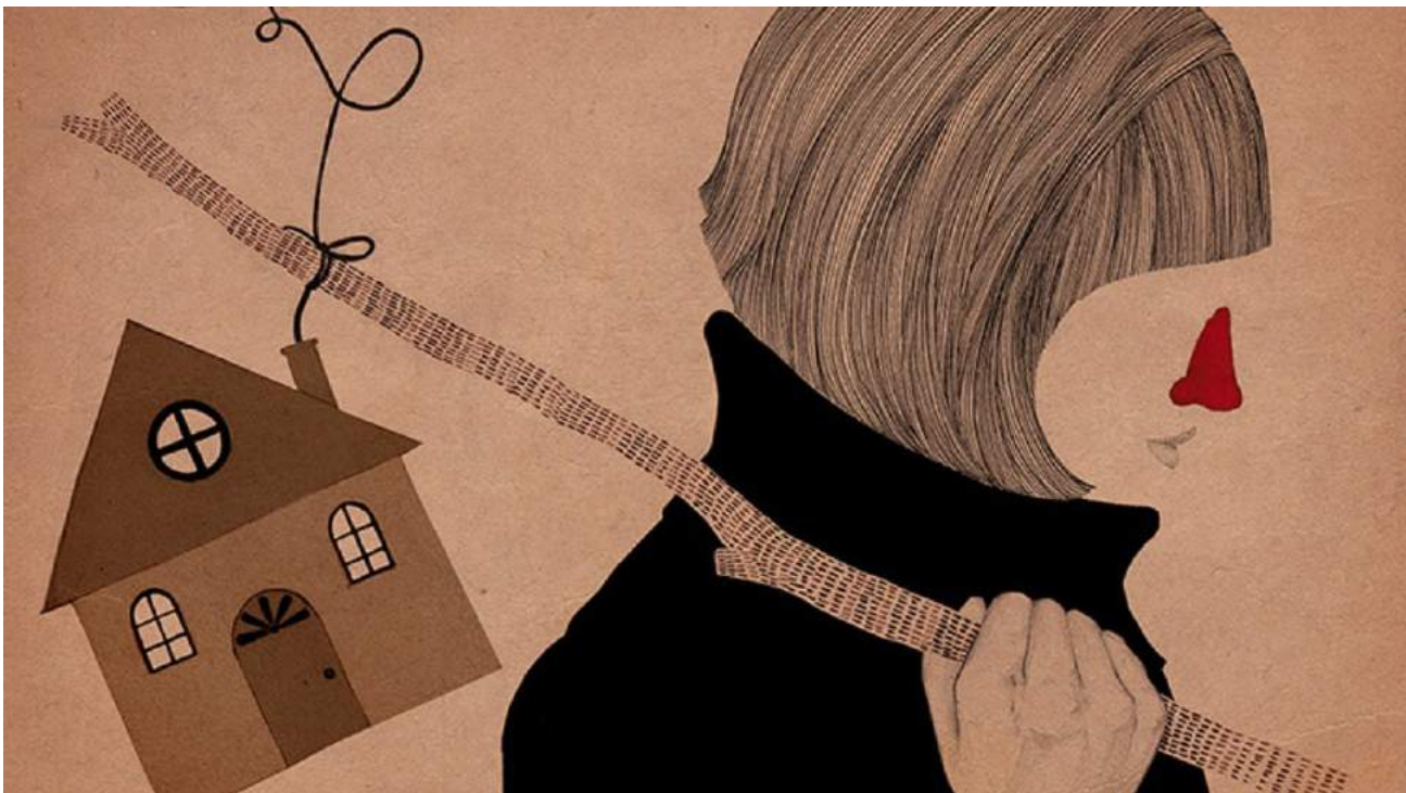
■ Sin título , ilustración, 2017 | Autora: Patossa. Tomado de: Patossa

ubica en un espacio de irreductible indiferenciación compartiendo la paradójica situación soberana.