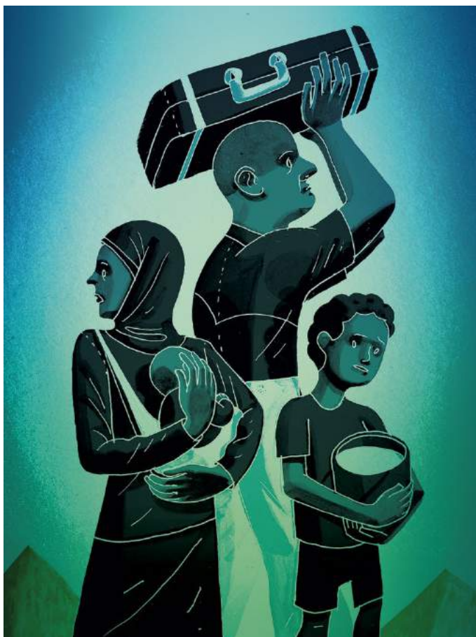
▪ Refugiados , ilustración, 2016 | Autor: Rob Donnelly.

En principio, el asilo es una figura jurídica protectora que debe ser garantizada por los Estados a favor de las personas que se ven obligadas a abandonar su país de origen o de residencia habitual, en cuanto se piense como un derecho fundamental; no obstante, el asilo se presenta también como una facultad o prerrogativa del Estado (Ortega, 2019), pues casi todos los países del mundo cuentan con sistemas nacionales de asilo por medio de los cuales determinan si las personas solicitantes en realidad merecen obtener protección internacional.