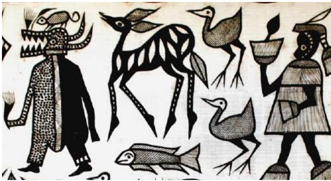
▪ Tapiz Senufo de Costa de Marfil (detalle), tejido | Autor: Desconocido.

acuerdos entre los Estados para lograr contribuciones equitativas, sostenidas y previsibles que garanticen la operatividad de los programas necesarios para cumplir los objetivos.