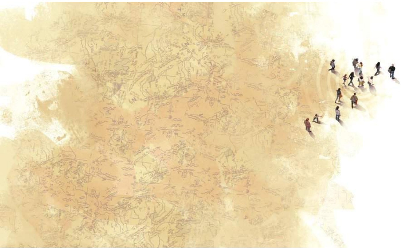
▪ Sin título, ilustración, Chile, 2018 | Autor: Vicente Martí.

dian te la globalización de la Iglesia, primero la católica y luego la protestante.