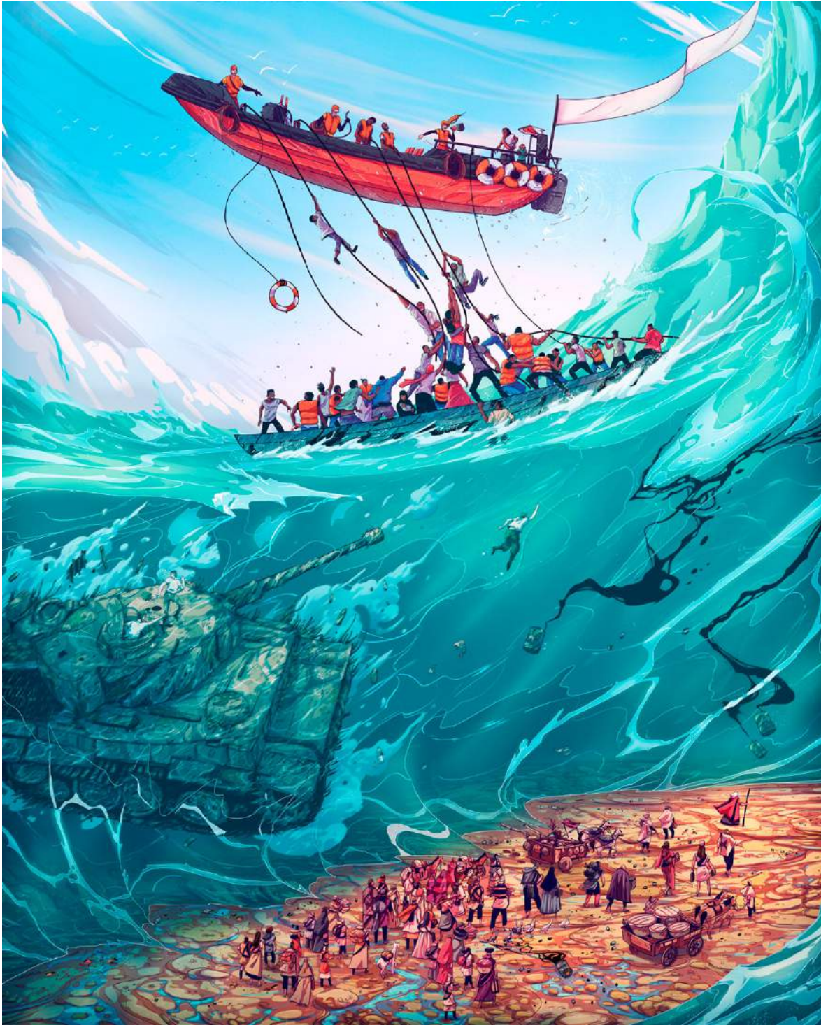
▪ Festival Cinexcusa , ilustración, Neiva (Colombia), 2019 | Autor: Christian Benavides. Tomado de: Voyager Illustration